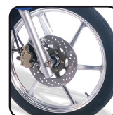
Llantas de aleacion.